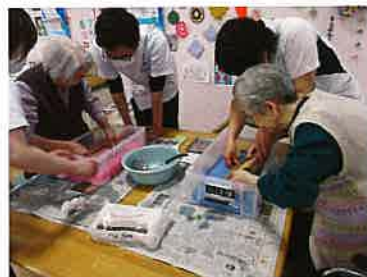
リハビリ職員とともに紙漉きに挑戦しました！はがきを作り一連の作業リハ・レクになりました

●作業療法により、手の動きやバランス能力が向上し、洗濯物たたみや料理、近所へのお出かけができるようになり、活動範囲が広がりました！