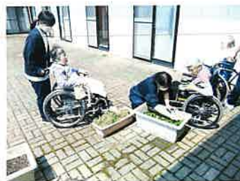
リハの後に、お天気の良い日には中庭に出てお花を愛でます

麻痺側下肢に装具を着用し、左手に杖を持ち、今では一人で屋外散歩ができるようになりました