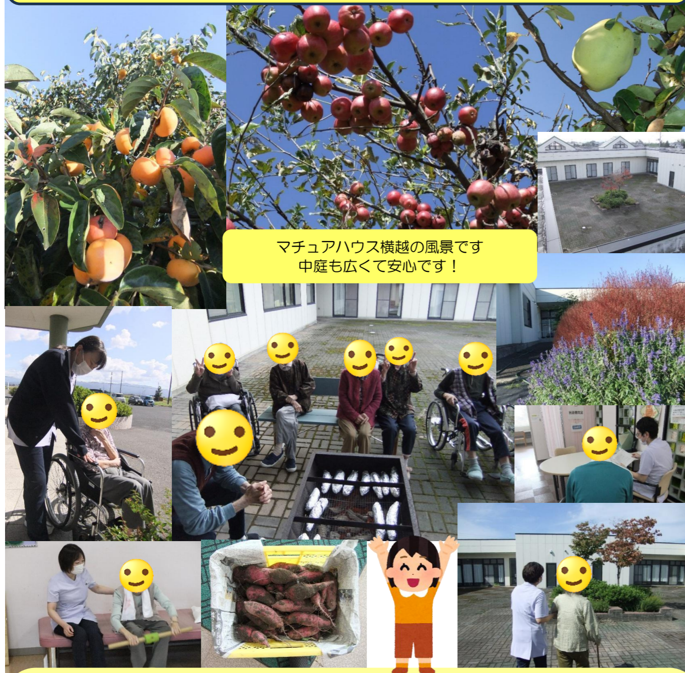
マチュアハウス横越の風景です 中庭も広くて安心です！

皆様、今年もお世話になりました。介護老人保健施設マチュアハウス横越は、常にご利用者主体の質の高い介護サービスの提供を心がけ、地域に開かれた施設として努めてまいりました。リハビリにつきましても、理学療法士、作業療法士、言語聴覚士 計8名体制(在宅復帰強化型老健で平均6.1人)で対応しています。管理栄養士も、3名配置し食事を通して楽しく健康にも配慮しています。