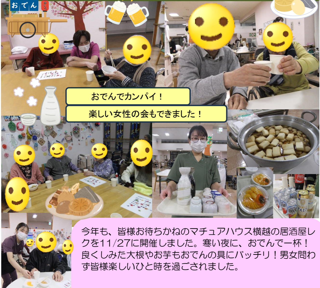
おでんでカンパイ！ 楽しい女性の会もできました！

今年も、皆様お待ちかねのマチュアハウス横越の居酒屋レクを11/27に開催しました。寒い夜に、おでんで一杯！ 良くしみた大根やお芋もおでんの具にバッチリ！男女問わず皆様楽しいひと時を過ごされました。